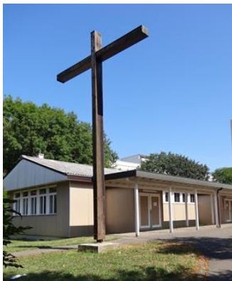
Chapelle Sainte Famille au Grand-Lancy Chemin des Palettes 23A 1212 Grand-Lancy