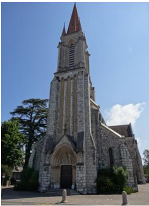
Église Notre-Dame des Grâces au Grand-Lancy Avenue des Communes-Réunies 5 1212 Grand-Lancy