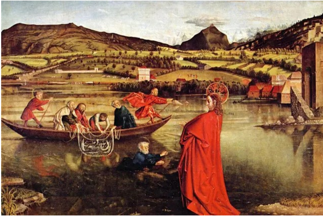
Pêche miraculeuse - Konrad Witz (1444) - Musée d'Art et d'Histoire (Genève)