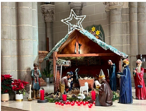
Eglise Notre-Dame des Grâces